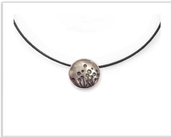
ook mooi aan een rubber koord

©Deze handleiding mag op geen enkele wijze geheel of gedeeltelijk vermenigvuldigd of gedupliceerd worden zonder voorafgaande schriftelijke toestemming van Joy for Art / Shop for Art.